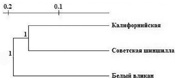
Рис. 2. Кластерный анализ значений генетических дистанций между исследованными группами кроликов, рассчитанных на основании спектров фрагментов геномной ДНК, фланкированных Sabrina 111 , с использованием программы TreeCon.