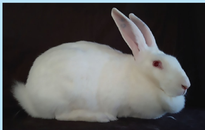
Новая порода кроликов Великородская белая .

Рисунок к статье Карелиной Т.К. и др. «Рациональное использование генетического потенциала кроликов породы белый великан отечественной селекции» (стр. 96)