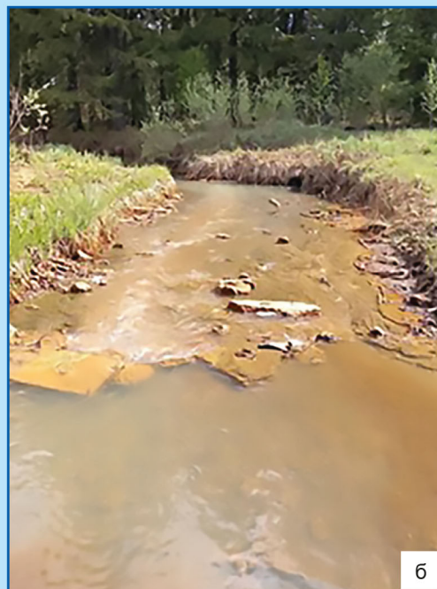
Места выплода кровососущих мошек на р. Цинга: а – 2008 год, б – 2023.